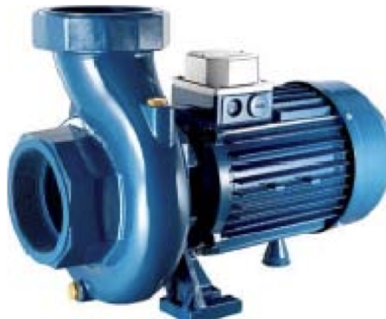
CG-1600 Вага: 41,1 кг (приблизно) Розмір: 480 x 250 x 330 мм (приблизно)