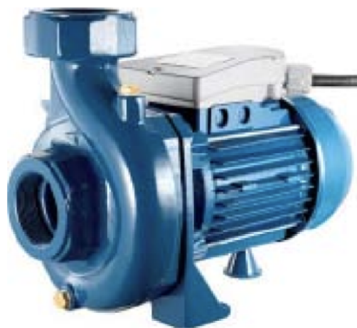
CG-1000 Вага: 31,6 кг (приблизно) Розмір: 455 x 225 x 292 мм (приблизно)

Fax ++34(9)73 445000 – 448400 Partida Horta d'Amunt, s/n – Apartado de Correos nº 149 E-25600 BALAGUER (Lleida) E-mail: gespasa@gespasa.es – http://www.gespasa.es